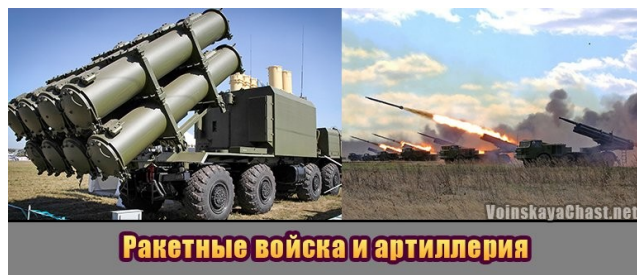
Ракетные войска и артиллерия

Какой срок службы в армии Вы считаете наиболее оптимальным? От 6 до 18 месяцев