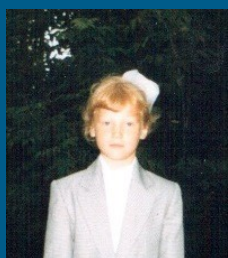
Теперь я первоклассница!