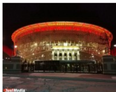
Стадион «Екатеринбург – Арена»

Чемпионат мира по футболу на территории России должен пройти с 14 июня по 15 июля 2018 года. На спортивных площадках Екатеринбурга, Москвы, Санкт-Петербурга, Казани, Волгограда и других городов России.