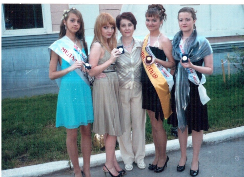
Наше богатство в выпускниках

Сегодня мы запускаем новую рубрику «О тех, кто рядом». О тех, кого каждый день лицезреем на уроках, на кого сердимся за объемное домашнее задание или злимся за низкие оценки! Они для нас как инопланетяне, мы же ничего про них, кроме того, что они наши учителя, не знаем!